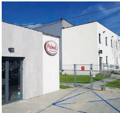
Фабрика Pol-Mak в Людвіні

У каталозі компанії POL-MAK також є: паста в італійському стилі - з борошна твердих сортів пшениці дурум; макаронні вироби яєчні в найвишуканіших фігурних формах, котрі завдяки яєчному складу не розварюються та зберігають ідеальну форму; макарони функціональні: цільнозернові, з низьким глікемічним індексом, для діабетиків та здорового харчування.