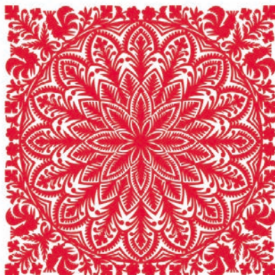
Традиційний орнамент POL-MAK

Компанія була заснована в Людвіні – це маленьке містечко за 30 км від Любліна, на території Ленчинсько-Влодавських озер. Саме з цим місцем родина є пов'язаною понад 100-ліття. Пам'ятаючи про походженням, фольклор та народну творчість Люблінського воєводства, упаковку наших макаронних виробів прикрашає унікальний й традиційний орнамент, створений місцевим художником Романом Проньським для Pol-Mak S.A.